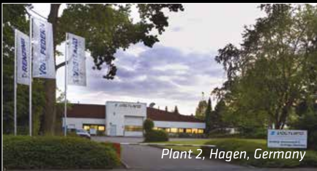
Plant 2, Hagen, Germany