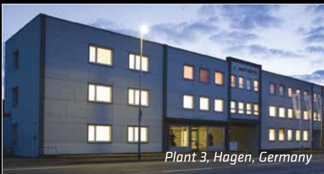
Plant 3, Hagen, Germany