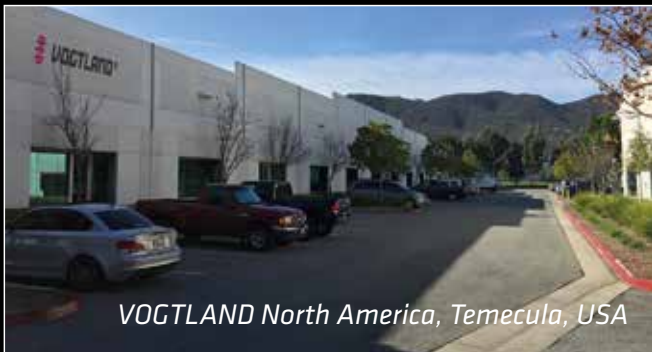
VOGTLAND North America, Temecula, USA